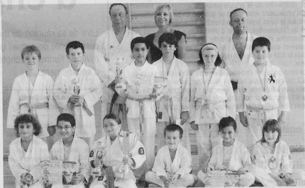
Fierté et joie pour les lauréats de la coupe du samouraï.